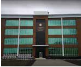
큰달 가구공업 학교