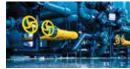
9. 가스 공급