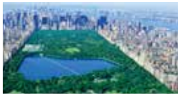
6. 조경 및 관리