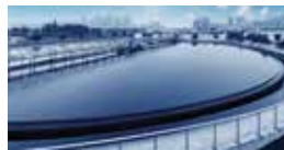
3. 폐수 처리