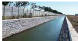
4. 배수 체계